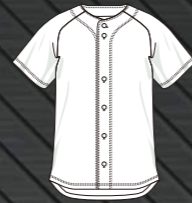
フルボタンタイプ

※初回発注は9着以上からお受けいたします。 ※追加発注では1着からお受けいたします。